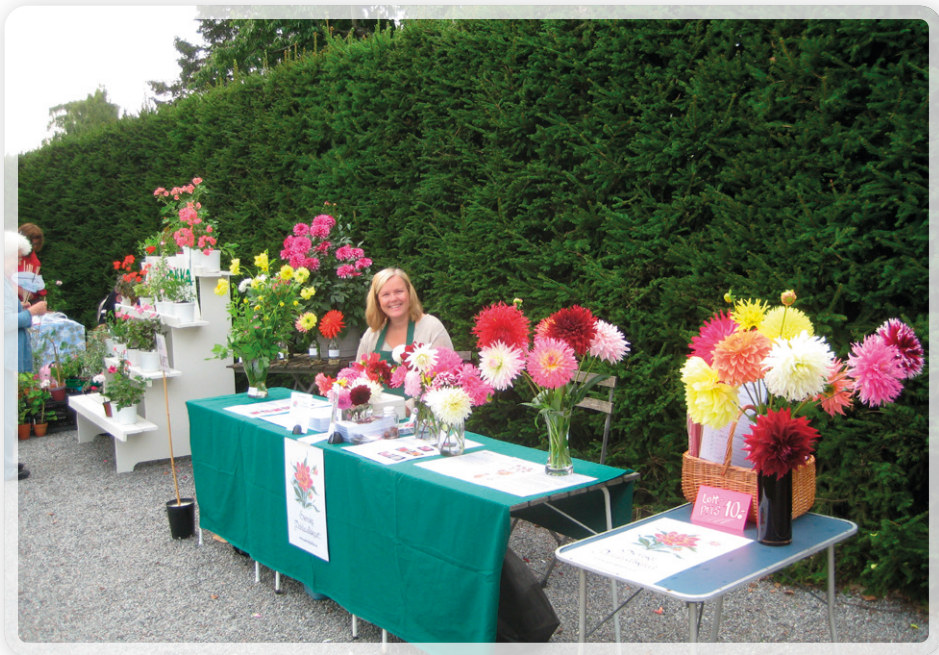
Charlotte, innan besökarna började strömma in.