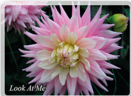
Look At Me