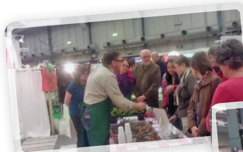
Foto från Nordiska Trädgårdar 2012.

MISSA INTE: På baksidan av detta nummer får du med en biljett till Nordiska Trädgårdar i Älvsjö. Klipp ur och ta med biljetten så får du 50 kr rabatt på inträdet.