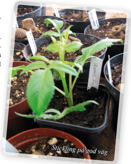
Stickling på god väg