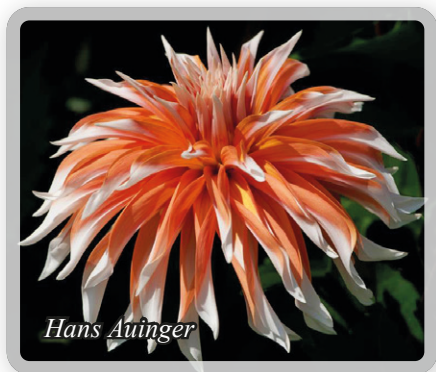
Hans Auinger är en ny dahlia som inte finns ute på marknaden ännu, men är en riktig skönhet att titta på!