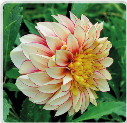
Polka kommer från Weibulls. En verkligt trevlig dahlia. Vit med röd bård. En anemondahlia. Den skall enligt förpackningen bli 45 cm hög. Men med "fötterna" i lite god jord stretar den utan vidare upp till 70 cm. Det enda negativa är att den då blir vek och behöver hjälp för att hålla sig upprätt. Den sätter ogärna frö eftersom diskblommorna är mycket täta och för långa för bina att nå förbi.