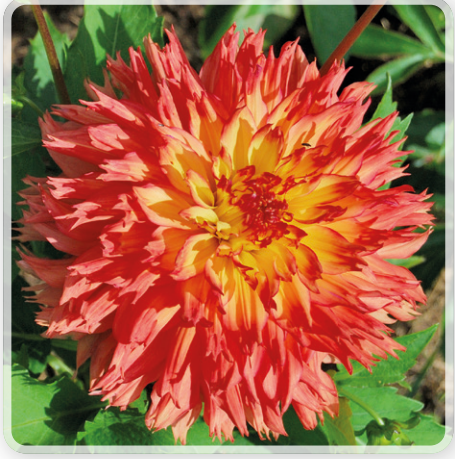
Snoho Wonder från Hemstede tillhör gruppen "fransade" dahlior och är verkligen praktfull. Blomman blir 18-20 cm och böjden 120. I år, med det vädret vi har haft blev den en meter.