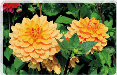
Orange Garden är från Hemstede i Holland. Enligt beskrivningen medelstor och det är den gott och väl. Och höjden är 110 cm. Det börjar väl märkas att jag är lite "svag" för just orange

Red. anm: Följande sidors text och foto av Per Samér