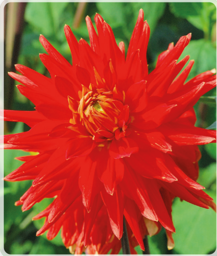
Vulcan kommer från Weibulls och kallas där kaktusdahlia och ser ganska annorlunda ut på deras förpackning. Stor och tät, medan min Vulcan är mycket glesare och ca 14 cm.