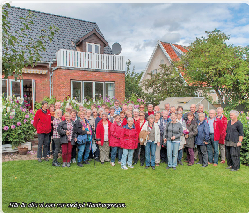
Här är alla vi som var med på Hamburgresan.