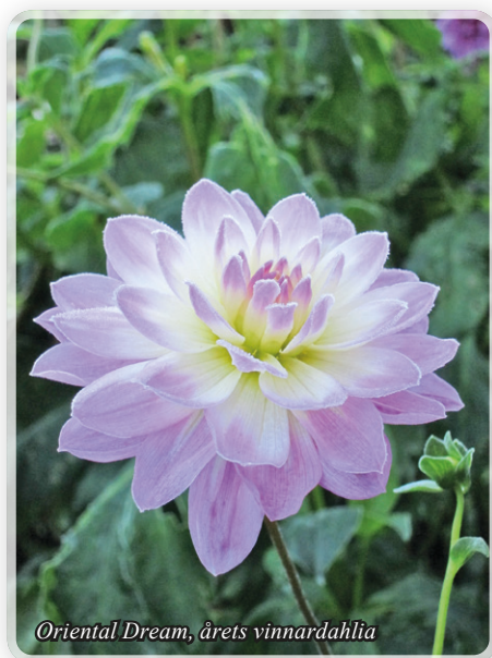
Oriental Dream, årets vinnardahlia