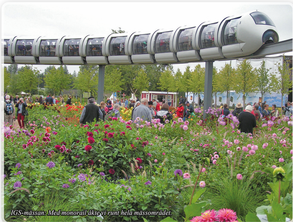
IGS-mässan: Med monorail åkte vi runt hela mässområdet.

Det var ett glatt bussgång med dahliaentusiaster som gav sig iväg. Resenärerna var från skilda platser i landet, från Gotland till Malmö. Att få träffa så många personer med samma intresse var kul. Bussen tog oss till Trelleborg för att åka vidare med färja. På båten lät vi oss väl smaka av den enorma buffén som var uppdukad. Mätta och trötta kröp vi sedan ner i våra sängar. Tidigt nästa morgon var vi framme i Travemünde och fortsatte vår resa till Hamburg.